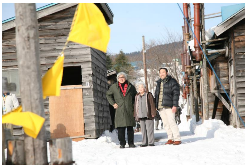
山田洋次監督と再会（幸福の黄色いハンカチ思いで広場）