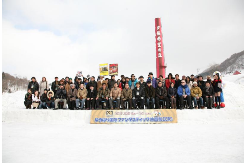
フォトセッション