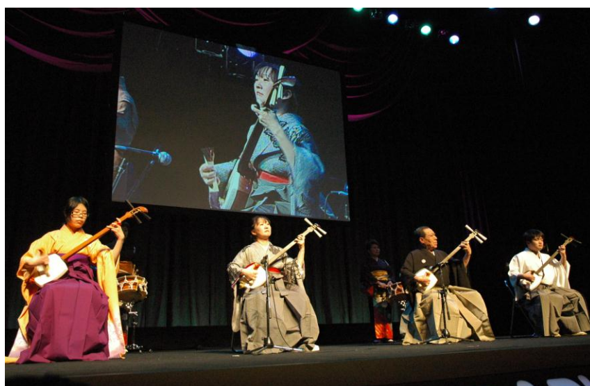
開会式 (夕張市芸能協会演奏)