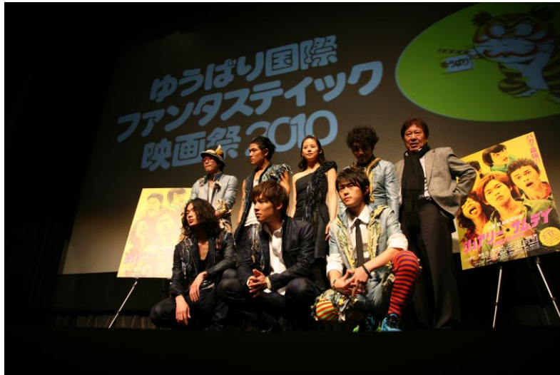
オープニング作品舞台挨拶（シュアリーサムデイ）