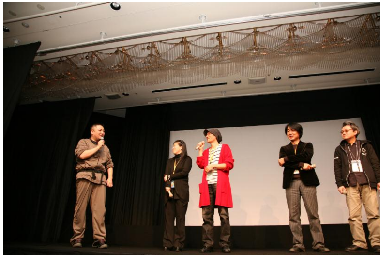
ゲスト舞台挨拶（ホテルシューパーロ）